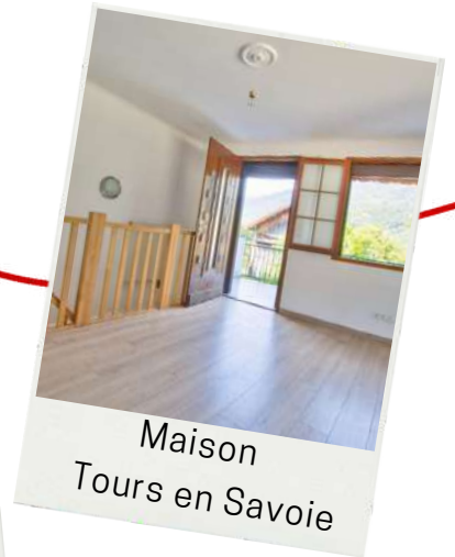
Maison Tours en Savoie